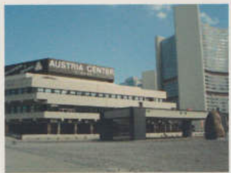
Austria Center – Vienna Auf dem Weg zur WIPA 08

Offizieller Beleg des OK WIPA 08 Nr. 0211