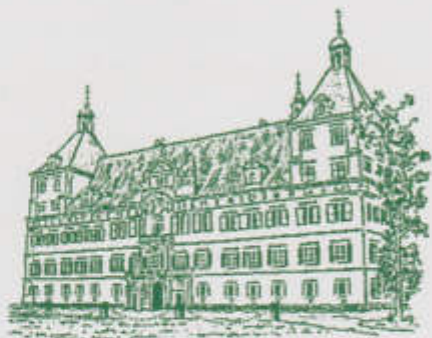
Schloß Eggenberg - Graz

Offizieller Beleg des OK WIPA 08 Nr. 0211