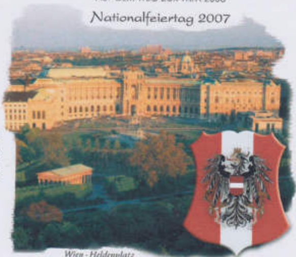
Wien - Heldenplatz

'AUF DEM WEG ZUR WIPA 2008' Nationalfeiertag 2007